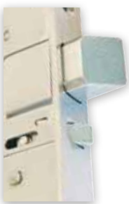
STEP 29 Silent™ kan ta utskjutande fallkolvar på upp till 20 mm.